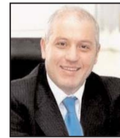
بقلم: ماهر أبو طير

لا يمكن للحرب الدائرة في السودان، حيث تتداخل أطراف دولية في المشهد الداخلي، إلا أن تؤثر على كل تلك المنطقة، وقد ثبت لدى المختبرات السرية في العالم، أن القدرة على تدمير أي بلد عربي، وتنشيطه بنيتة أمر ليس صعباً، وسيناريو التقسيم ينتقل من بلد