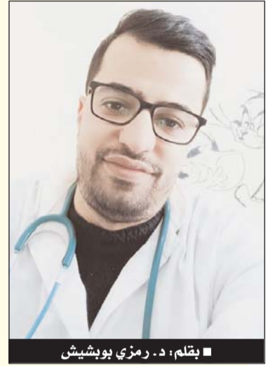
■ بقلم: د. رمزي بويشيش

- انسداداً في الأمعاء وخاصة عند حديثي الولادة