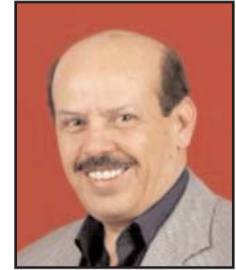
بقلم: عيسى الشعيبي

ومثلما يسخن الماء في المرجل، ويتحول عند درجة حرارة عالية إلى بخار ذي طاقة انفجارية، أو قوة يمكن التحكم بها وتطويعها لتشغيل المولدات الحرارية، وجرّ عجلة قطار متعدّد العربات، كذلك يشتدّ الاحتقان شيئاً فشيئاً، وتسخن حالة القلق على النطاقين الخاص والعام، ويكتسب هذا الخليط، مع مرور الوقت، خاصية البخار وقوته التدميرية، إن لم يُحسن الأفراد مداواته بالصبر الجميل وقدر قليل من رباطة الجأش،