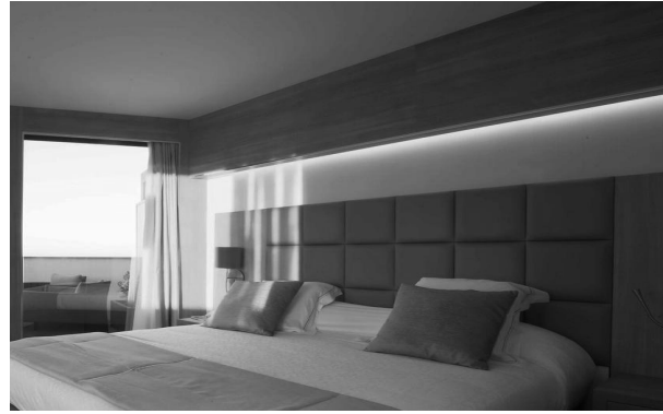
تصل في مجملها إلى 1540 سرير و400 منصب شغل

وجاءت هذه المرافق السياحية لتعزيز الحظيرة الفندقية بوهران البالغ عددها بـ 201 فندقاً تضم 20334 سرير سمحت باستحداث 5200 منصب شغل.