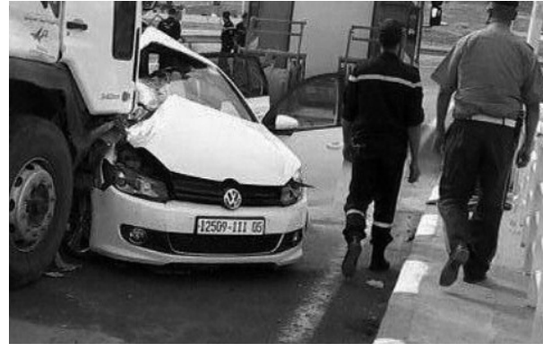
765 حريقا منها منزلية صناعية وحرائق مختلفة،

لقي 39 شخصا حتفهم وأصيب 1434 آخرون في 1050 حادث مرور خلال الفترة الممتدة من 14 إلى 20 ماي، سجلت بمناطق متفرقة من الوطن، حسبما أوردته أمس الثلاثاء حصيلة لمصالح الحماية المدنية.