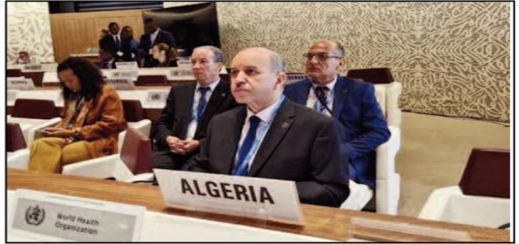
إلى الرعاية الطبية الضرورية

وأفاد بيان لوزارة الصحة أن اللقاء الذي جرى على هامش أشغال الدورة الـ 76 للجمعية العامة لمنظمة الصحة العالمية بجينيف، شكل فرصة للطرفين لتباحث مجالات التعاون التي يمكن إقامتها بين البلدين وفق برنامج عمل يتضمن عددا من النشاطات من بينها ضمان التكوين المهني للصحة في ظل الخبرة التي تتوفر عليها الجزائر في هذا المجال بالإضافة إلى تطير الأطباء، خاصة في التخصصات الجراحية مع امتداد عملية التكوين لتشمل مجال التسيير في الميدان الصحي. وكان وزير الصحة، عبد الحق سايحي، قد اجتمع أيضا مع وزير الصحة الأرفني، فراس إبراهيم الهوراي. وأفادت وزارة الصحة، في بيان، أن الطرفان بحثا