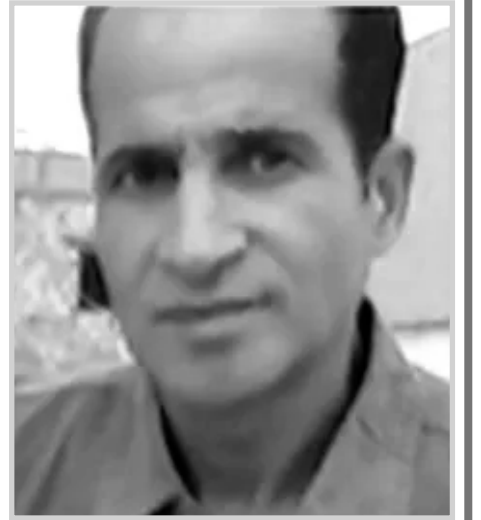
بقلم: جمال نصرالله

تجد شخصا عربيا بلغ من العمر عتيا لا زال يتأثر ومولع بالتقليد دون إدراك منه عن المصادر والغايات. وفي المقابل تجد شابا جامعا متمدرسا يفعل نفس الشيء، المسألة ليست مسألة أعمار قدما هي مسألة فهم وتفسير واستنباط وقرآنة تحميصية للذات وتأثيرها المباشر وغير المباشر بالعالم وبالمجتمعات الأخرى. مقولة ابن خلدون المغلوب مولع بتبعية الغالب ما زالت تلقي مفعولها بقوة وقبله قال المتنبي (ومن ين يسهل عليه الهوان. ما الجرح ببيت إيلام) أي أن يجعل المرء نفسه فريسة ولقمة سائغة لكل من هب ودب. لقد حاولنا أن نجد تفسيرا وافية لهذا التأثير المشين انطلاقا من احتفالات رأس السنة الجديدة كمثال حي. ولماذا ينغمس معظم الناس أسرا وأفرادا في طقوس لا يفقهون لها آخرها ولا أولا. فأنت إذ سألت شابا (لماذا تحتفل مثلا هذه اللحظات برأس السنة الميلادية، فهو يجيبك اجابة بسيطة وغطية، وإذا استرسلت معه، وجدت نفسك في دائرة من الخواء الفكري والروحي مرتسمة أمامك) المهم التقليد فقط والتقليد، وتخرج بنتيجة مفادها أن المعني يدفع مع الكل بكلتا يديه عربية بحمار ميت؟! ثم تحاول أن تتفلسف معه قليلا، على شاكلة أنه عيد ميلاد عيسى المسيح عليه السلام. وأن الأوربيين مخطوون منة بالملة في تحديد هذا التاريخ لأن القرآن الكريم يقول بأنه ولد في شهر الصيف وليس في ديجمبر، ولو سلمنا بأنهم