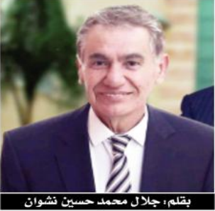
بقلم: جلال محمد حسين فزوان

جميلة لدرجة أن الثمانية والعشرين حرفا لا تكفي لوستذك.