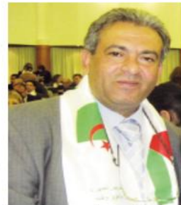
تقرير: علي سمودي

منعورين، واكتشفنا أنهم فجروا أبواب المنزل وتم تكسير كافة النوافذ، وتحول منزلنا لتكنة عسكرية كأنهم قادمين لساحة حرب .. كسروا محتويات المنزل وكافة الأجهزة والأدوات، ولم يبق شيء دون تكريب، واحتجزوني وأسرتني في غرفة لوحيدنا وعزولوا أحمد عنا، وأدخلوا كلاب بوليسية عليه، حتى شعرت برعب وقلق عندما سمعت صراخ ابني من شدة الألم بسبب نهش الكلاب له على مرأى من جنود الاحتلال، فركضت بسرعة مذعورة لانقاذ، لكنهم احتجزوني ودفعوني داخل الغرفة، وهددوني برش الغاز إذا لم التزم في مكان احتجازنا، وكنت أشهد 4 جنود، يحاصرون أحمد ويمتدون عليه بالضرب بشكل وحشي وهو يواصل الصراخ وسط تحقيق ميداني استمر من الساعة الثالثة فجراً حتى السادسة صباحاً. تنهمر دموع أم وسام، وتقول "ما حدث كان صادماً وصعباً ومؤلماً بالنسبة لنا وسألناهم عن السبب، خاصة وأن أحمد قاصر ولا ينتمي لأي حزب وليس له نشاط سياسي، ورغم ذلك رفضوا الاجابة عن أسألتي، قيدوه وعضبوا عينه وانزعوه من بيننا دون سؤال أو جواب، وتوقعنا أن هناك خطأ في مسألة اعتقاله، وبقيت انتظر الإفراج عنه في كل لحظة، وتزايدت مخاوفي ومعاناتي بعدما نقلوه لمركز التحقيق، وبعد فترة أبلغنا أحمد أنه تعرض للتعذيب في زنازين سجن الجلمة على مدار 29 يوماً، عانى خلالها من حرارة السجن والسجان، وقضى فترة طويلاً مصلوباً على الكرسي ليل نهار، ومنع من زيارة المحامين". في قرية بئر الباشا، ولد