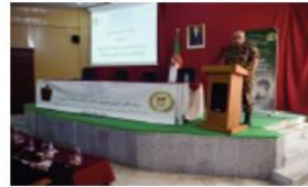
الملتقى الذي عرف حضور ضباط وإطارات

نظمت المديرية الجهوية للإعلام والاتصال بالناحية العسكرية الأولى، ملتقى جهوي بعنوان، "دور الإعلام الجديد ومنصات التواصل الاجتماعي في ظل الحروب الحديثة". على مستوى مركز الإعلام الجهوي بالبلدية الشهيد محمد مادي/ ن ع 1.