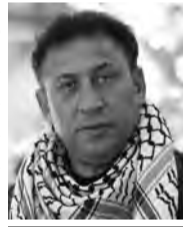
بقلم: سامي إبراهيم فودة

على شهادة دبلوم تأهيل دعاء. له رواية ألّفها خلال فترة اعتقاله وهي "رواية المعمة"، - تاريخ الاعتقال: 2002/11/21 - تاريخ الإفراج: 2023/5/18 - مكان الاعتقال: نفحة الصحراوي - التهمة الموجه إليه: الانتماء والعضوية في حركة الجهاد الإسلامي والمشاركة في عمليات للمقاومة ضد قوات الاحتلال الصهيوني. - الحالة القانونية: - عشرون عامًا ونصف.