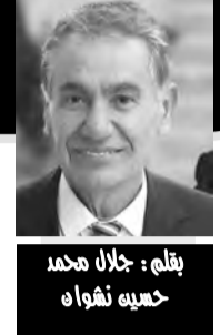
بقلم: جلال محمد حميد نواه