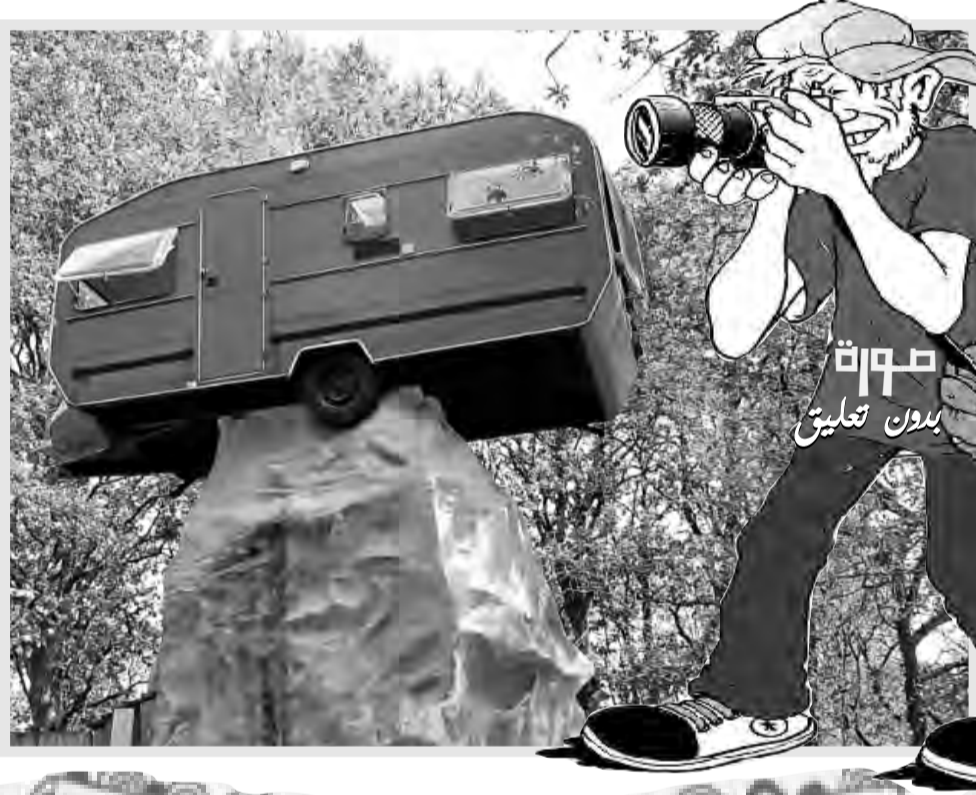
صورة بدون تعليق

اكتشف علماء الآثار في بولندا هيكل عظميا لشخص عاش قبل نحو 7000 عام بالقرب من منطقة تعرف الآن باسم كراكوف. ويعود الهيكل العظمي لحقبة العصر الحجري الحديث، حيث اكتشف أثناء تجديد ساحة البلدة في سومبيكي. وقال العلماء، إن الهيكل العظمي في حالة ممتازة وغثر بجوانبه على شظايا من الفخار، واستنادا إلى أسلوب صناعة الفخار، فإنه قد ينتمي إلى ثقافة الفخار الخطي 4500-5500 قبل الميلاد، أي أن من المحتمل أن يعود تاريخ الدفن إلى حوالي 7000 عام، بحسب موقع لايف ساينس. واعتبر العلماء أن هذا الاكتشاف مثير ومهم للغاية.