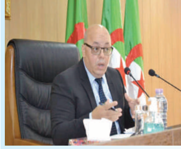
أشاد بما صنعه المؤرخون الأوائل من أجل الحفاظ على كتابة التاريخ الوطني