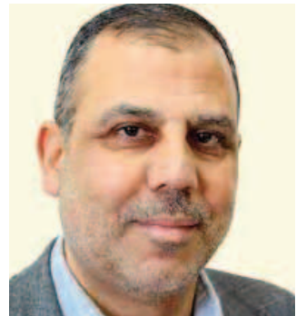
بقلم: يهودا هودي

جم أحقادهم والفضب الذي يغلي في صدورهم على الشعب الفلسطيني الذي لا ناقة له فيها ولا جمل. بن غفير شخصية شديدة التطرف مسكونة بالخدق والهوس والمزايدة على غيره من جمهوره المتطرف وقد نجح في جر بقية العصابة المتطرفة أصلا إلى مربعه الأسود، فكان هذا العدوان الشرس الذي كان أغلب ضحيتة من الأطفال والنساء والناس الذين لا علاقة لهم بما أعلن من أهداف عدوانية، ثم ينتج ويعتبر ذلك إنجازا لحكومته، فأني صلف هذا أية غطرسة؟ ولماذا تجدهم دوما يتكلمون دور الضحية ويثرون ما فعلته بهم النازية فيما عرف بالهولوكوست أو الخرق؟ ماذا يعتبرون ضرب شقّة سكنية بالصواريخ والتي من المعروف مسبقا أنها ستقتل أطفالا وستصيب أناسا في الشقق المجاورة وسترتب منطقة سكنية بأكملها، لماذا يصمت العالم الخُر على هذا الهولوكوست المنتقل الذي تقتصحه البرن القاتلة والحارقة في المكان الذي تسقط فيه صواريخهم؟ وهنا قد يسأل سائل وماذا عن صواريخكم؟ لئذ إلى السؤال من الضحية الاحتلال أو من يدافع عن نفسه من جرائم الاحتلال؟ وكيف تضع حدا لجرائمهم، هل ينفذ ذلك الاسترحام واستدرا العطف العالمي الذي بدوره سيسحب