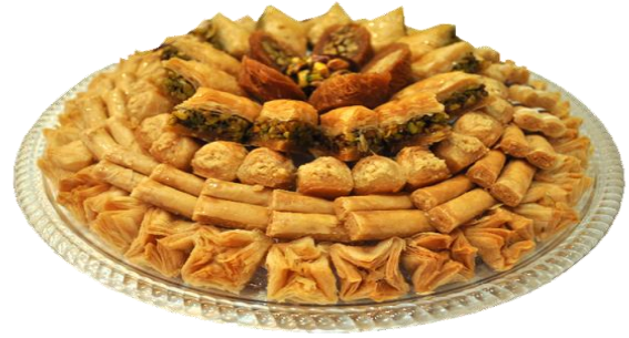
الوثيقة 03 : طبق من الحلويات الشرقية .

معتمدا على السندات المقدمة و مكتسباتك ، أجب عن التعليمات التالية :