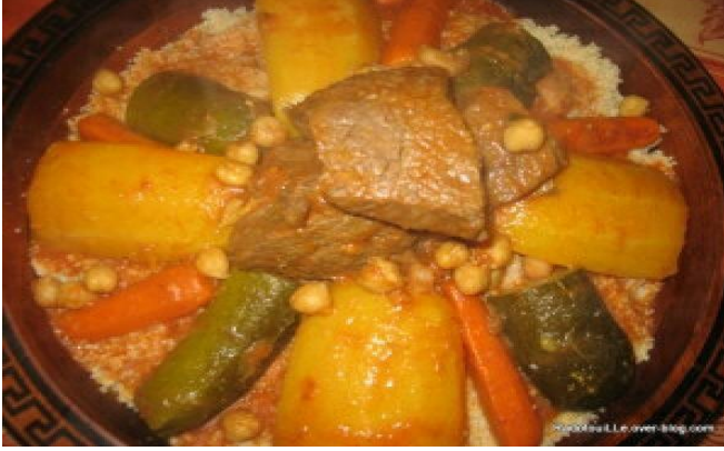
الوثيقة 02 : طبق الكسكسي الشهير .