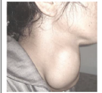
صورة جانبية لامرأة مصابة بالمرض