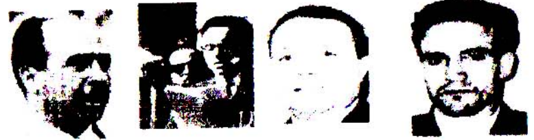
من أعضاء لجنة التنسيق والتنفيذ